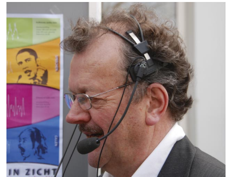
Stembereik wordt gemeten

Soms moest er wel 20 minuten gewacht worden voor je aan de beurt was. De geteste personen waren zeer