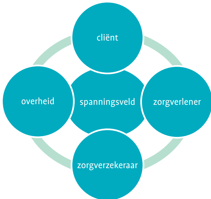
Figuur 1. Spanningsveld tussen de verschillende belanghebbenden binnen het zorgverleningsproces.

Binnen het huidige gezondheidsbeleid (Wet Maatschappelijke Ondersteuning (Ministerie van Volksgezondheid Welzijn en Sport, 2007), Wet Geneeskundige behandelingsovereenkomst (Klink & Bussemaker, 2008)) treden er veranderingen op. Het wordt steeds belangrijker om behandelingen van chronische aandoeningen meer te richten op hun effectiviteit voor het leven van de persoon met zijn communicatieve beperking en zijn directe omgeving. Er wordt meer verantwoordelijkheid gelegd bij de zorgvrager en een andere rol verwacht van de zorgverlener. Als zorgverlener bevinden wij ons in een voortdurend spanningsveld (zie Figuur 1):