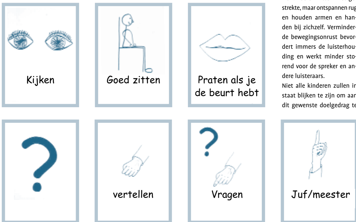
Afbeelding 1 Overzicht van de gebruikte picto's.

Niet alle kinderen zullen in staat blijken te zijn om aan dit gewenste doelgedrag te